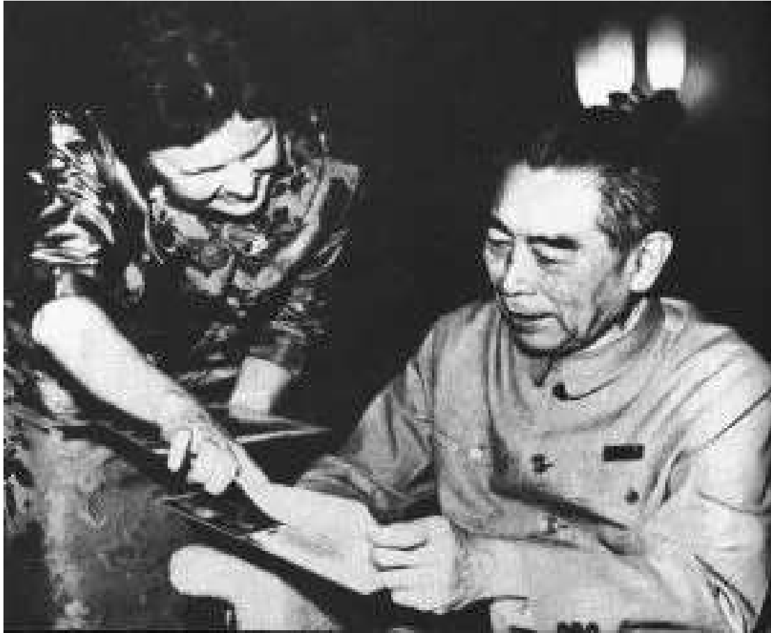
弗朗西丝·鲁茨·哈登和周恩来总理看老照片（1972）

Original 陈晖 经济观察报观察家 2024-03-26 04:30 北京