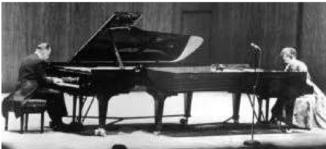
哈登夫妇的北京音乐会（1972年）

1949-1972年期间，尽管周恩来总理与鲁茨主教家族无法联系，但在合适的外交场合，总理总能打听到鲁茨家族情况，他知道新年贺卡往哪里邮寄，在家族成员重要的日子时，总会想办法发去贺信。鲁茨主教的长子约翰·鲁茨是作家和国际记者，1971年美国总统尼克松访华前，他是受邀来华的记者之一，参与了对周恩来总理的采访。约翰一回到美国就向《时代》杂志和《纽约时报》报道了他对周恩来总理的访问。1974年10月，周恩来总理在医院接见约翰，他是总理最后接见的两位美国人之一，约翰临走时，周恩来总理说：“中美之间的大门不应该关上。”回美国后，约翰开始撰写《周恩来传》，并于1978年出版，很多关于周恩来的事迹都在里面有详细记载。